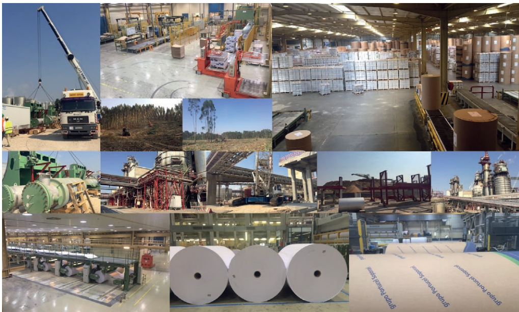
Modernización y mejoras medioambientales de una fábrica de pasta de papel y papel en Figueira (Portugal).

En 2020, el Banco prestó 28 millones de euros al fabricante portugués de pasta de papel y papel The Navigator Company, para ayudarle a aumentar la producción de energía renovable mediante la instalación de una nueva caldera de biomasa en su fábrica integrada verticalmente situada en Figueira da Foz. La empresa pudo así eliminar gradualmente los equipos obsoletos y aumentar el uso de cortezas y subproductos de madera propios para producir energía renovable. El proyecto mejoró el rendimiento medioambiental de la fábrica, reemplazando el uso de combustibles fósiles por energía verde, lo que redujo significativamente las emisiones de gases de efecto invernadero.