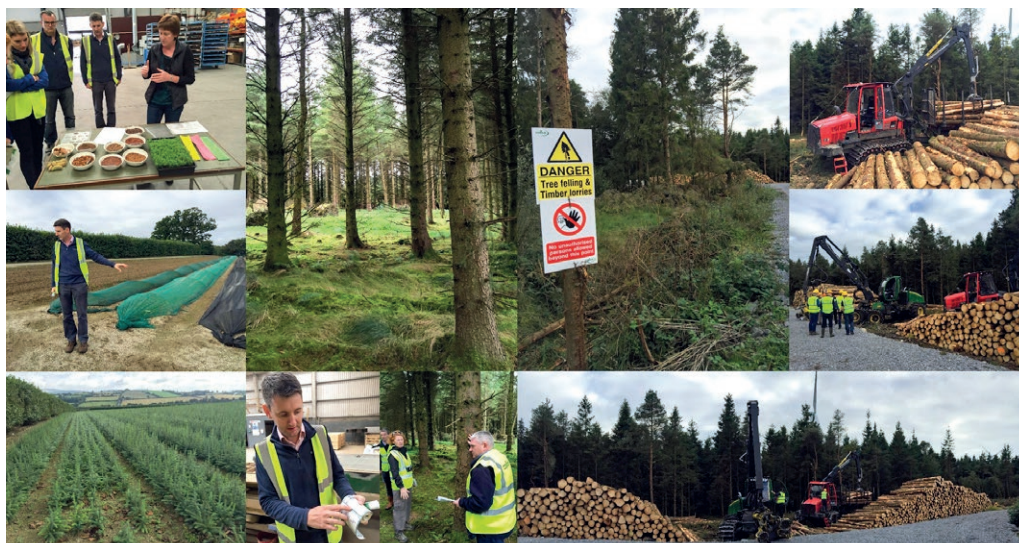
Producción de plántulas, plantación de árboles y gestión forestal en Irlanda, 2016.