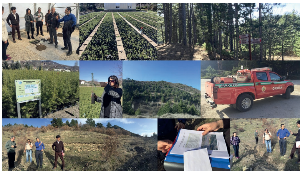
Forestación y lucha contra la erosión en Turquía, 2016.

El Banco Europeo de Inversiones concedió tres préstamos a Turquía entre 2010 y 2015 para apoyar la forestación y la lucha contra la erosión . El total de la financiación del Banco, por un importe de 420 millones de euros , movilizó más de 1 000 millones de euros en inversiones de 2011 a 2018.