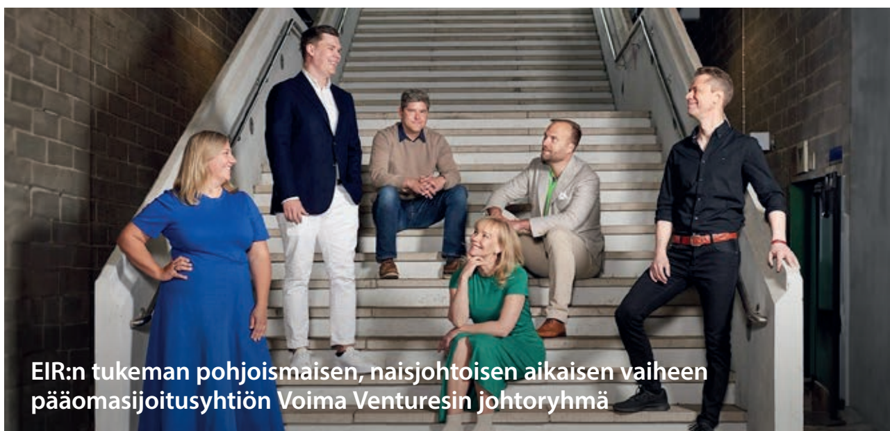
EIR:n tukeman pohjoismaisen, naisjohtoisen aikaisen vaiheen pääomasijoitusyhtiön Voima Venturesin johtoryhmä

Voiman ja Taalerin investointien tukena on Euroopan komission InvestEU-ohjelma, jonka tavoitteena on saada liikkeelle yli 372 miljardin euron lisäinvestoinnit vuosina 2021–2027.