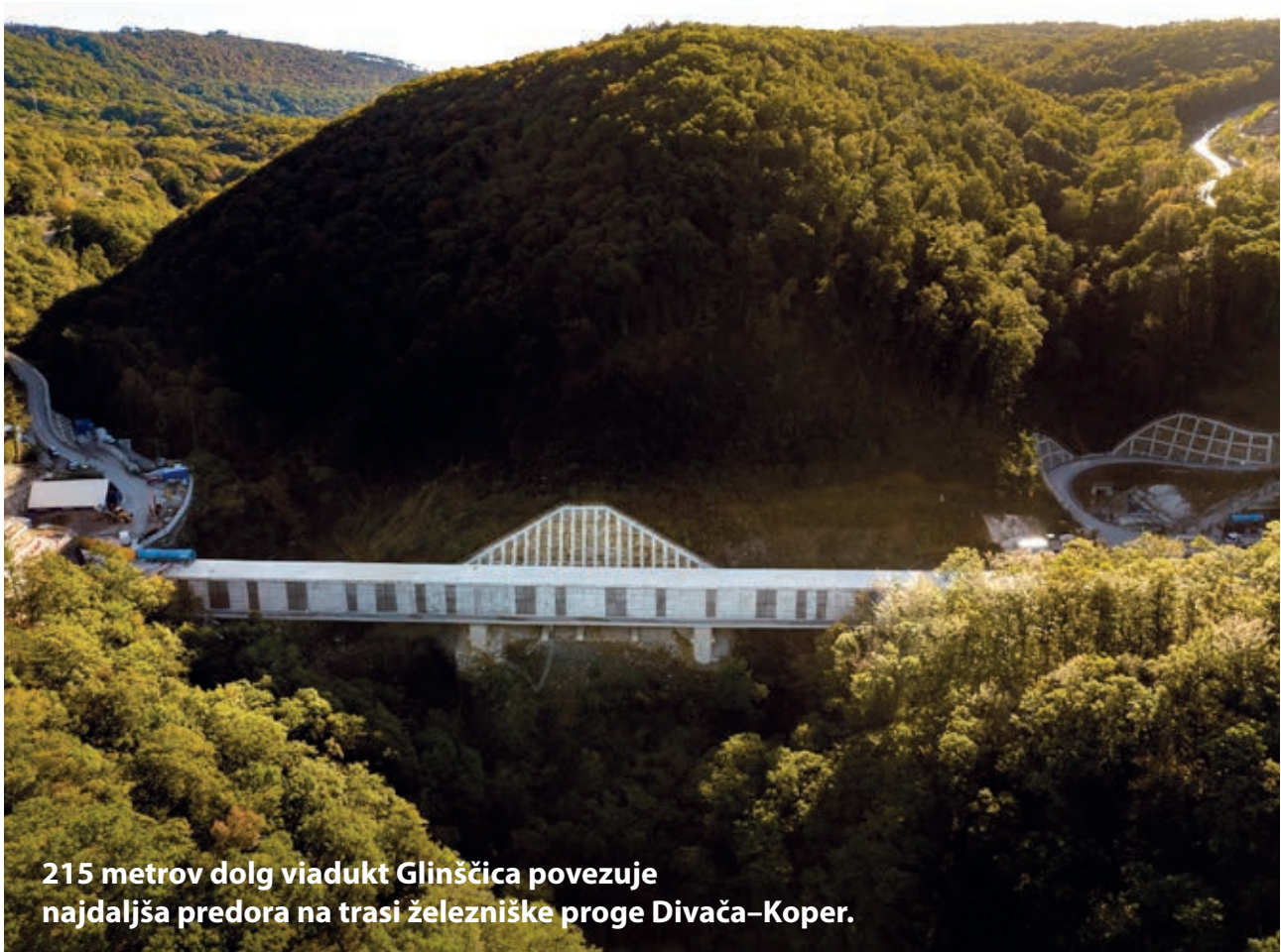
215 metrov dolg viadukt Glinščica povezuje najdaljša predora na trasi železniške proge Divača–Koper.