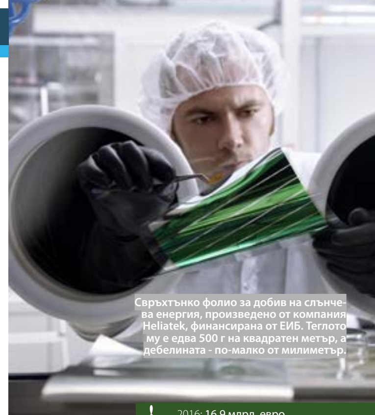
Свърхтънко фолио за добив на слънчева енергия, произведено от компанията Heliatek, финансирана от ЕИБ. Теглото му е едва 500 г на квадратен метър, а дебелината - по-малко от милиметър.

Банката ще продължи да подкрепя подобни инвестиции, за да съдейства за прехода на ЕС към кръговата икономика. Когато е оправдано, банката ще финансира и съоръжения за обработка на остатъчни отпадъци, необходими за постигане на целите за отклоняване на биологичните отпадъци от депата за отпадъци.