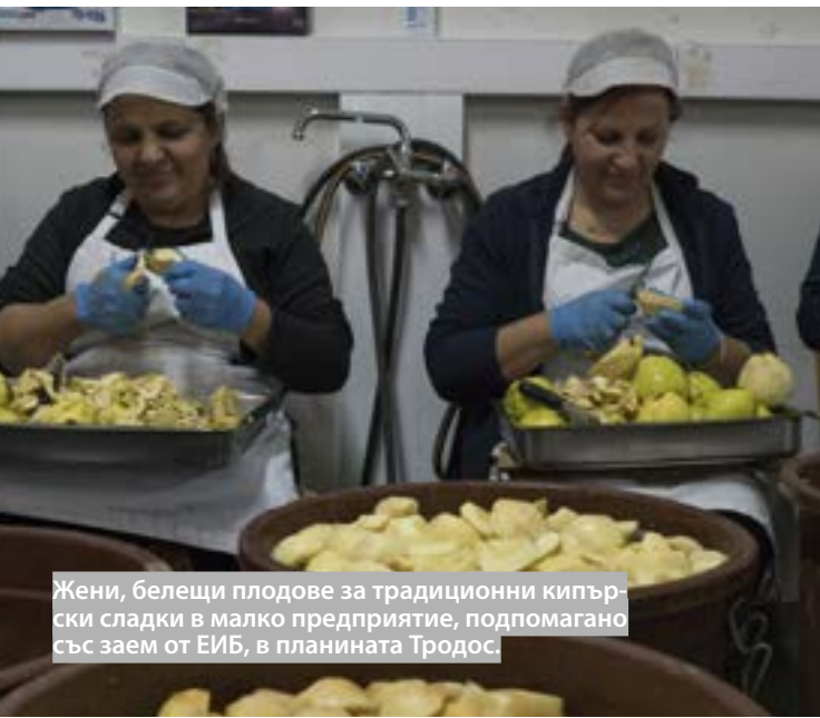
Жени, белещи плодове за традиционни кипърски сладки в малко предприятие, подпомагано със заем от ЕИБ, в планината Тродос.