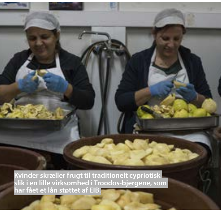
Kvinder skræller frugt til traditionelt cyprisk slik i en lille virksomhed i Troodos-bjergene, som har fået et lån støttet af EIB.

EIB vil fortsat fremme investeringer i land- og skovbrug, der er direkte målrettet afbødning af eller tilpasning til klimaforandringer og støtter offentlige miljøgoder som landskaber, landbrugsjordens biodiversitet, klimastabilitet og større modstandsdygtighed over for naturkatastrofer. I landbrugets værdikæder vil EIB fortsat støtte ressource- og energieffektive projekter, der bidrager til produktionen af varer, der er sunde, mere nærende og/eller sætter et mindre miljøaftryk.