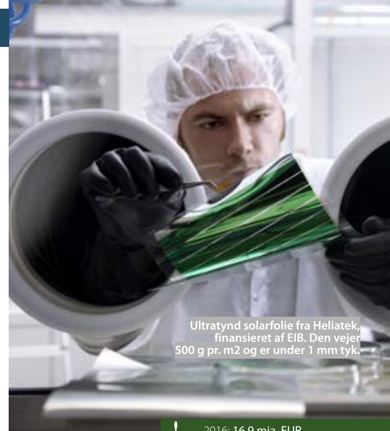
Ultratynd solarfolie fra Heliatek, finansieret af EIB. Den vejer 500 g pr. m 2 og er under 1 mm tyk.

Uden for EU forventer EIB fortsat at støtte mikrovirksomheder og at fremme udviklingen af den lokale finansielle og private sektor ved långivning gennem formidlere (også i lokal valuta) samt, i stigende grad, rådgivning. De fonde, der dækker behovene uden for EU hos småbønder, producentorganisationer og mikro- og små virksomheder inden for landbrug, håndterer ofte også spørgsmål som migration og afbødning af og tilpasning til klimaforandringer.