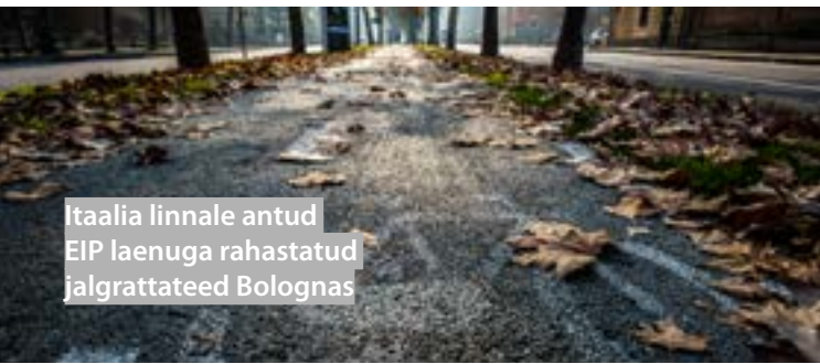
Itaalia linnale antud EIP laenuga rahastatud jalgrattateed Bolognas

EIP prioriseerib vähem arenenud piirkondi ja on keskendunud puuduvatele lülidele, ummikutele pikamaatranspordis, piiriületusstruktuuride koostalitlusvõimele ja reisijate üleminekukohadele eri transpordiliikide vahel. EIP suudab pakkuda toetust ka piirkondlikele lennukirendi- ja liisingufirmadele, nagu ka TEN-T-välisele strateegilise tähtsusega infrastruktuurile.