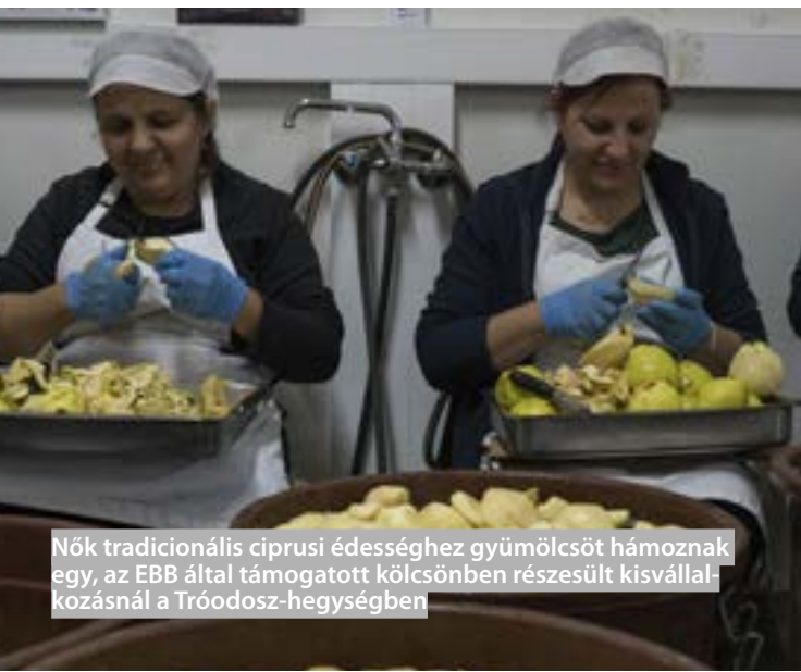
Nők tradicionális ciprusi édességhez gyümölcsöt hámoznak egy, az EBB által támogatott kölcsönben részesült kisvállalkozásnál a Tróodosz-hegységben

a mikro-, kis- és középvállalkozásoknak nyújtott közvetített finanszírozással foglalkozó részleg vezetője