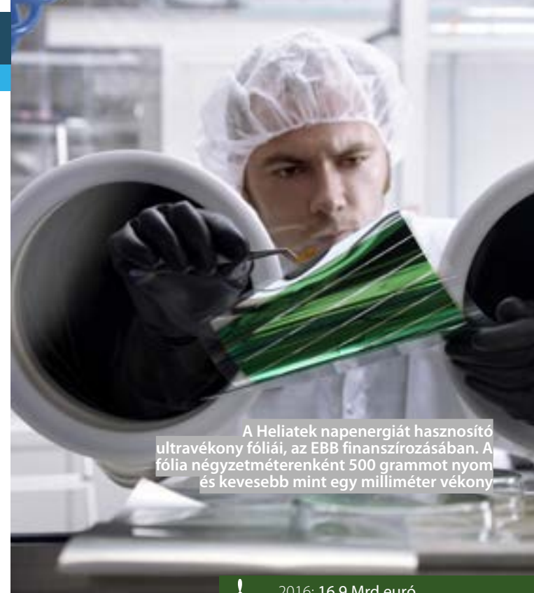
A Heliatek napenergiát hasznosító ultravékony fóliái, az EBB finanszírozásában. A fólia négyzetméterenként 500 grammot nyom és kevesebb mint egy milliméter vékony

A Bank továbbra is támogatja az ilyen beruházásokat az EU körforgásos gazdaságba való átmenetéhez való hozzájárulás érdekében. A Bank indokolt esetben a biológiai hulladékok szeméttelpekről való eltérítésével kapcsolatos célok teljesítéséhez szükséges, maradáshulladékot kezelő létesítményeket is finanszíroz.