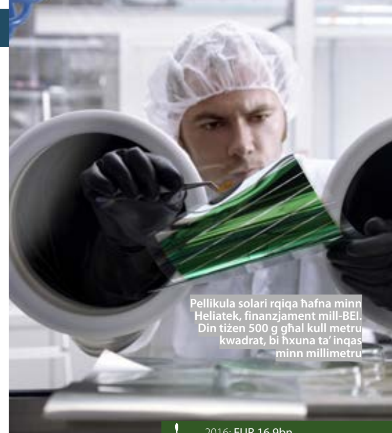
Pellikula solari rqiqa hafna minn Heliatek, finanzjament mill-BEI. Din tiżen 500 g għal kull metru kwadrat, bi ħxuna ta' inqas minn millimetru

Barra mill-UE, il-BEI huwa mistenni jkompli jappoġġa lill-mikrointrapriżi u li jipprovmovi l-iżvilupp lokali finanzjarju tas-settur privat permezz ta' tisliif intermedjat (ukoll fil-munita lokali) u, b'mod dejjem akbar, servizzi ta' konsulenza. Il-fondi li jkopru l-ħtiġijiet ta' detenturi żgħar, organizzazzjonijiet ta' produtture u intrapriżi rurali ċkejknin u żgħar barra mill-UE spiss jindirizzaw ukoll kwistjonijiet bħall-migrazzjoni u l-mitigazzjoni tat-tibdil fil-klima u l-adattament għalih.