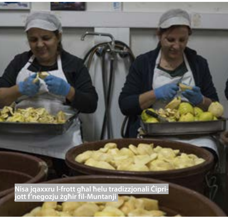
Nisa jgħaxxu l-frott għal ħelu tradizzjonali Ċiprijott f'negozju żgħir fil-Muntanji

Fil-katini ta' valur agrikolu l-BEI ser ikompli jappoġġa proġetti effiċjenti fl-użu tar-riżorsi u l-enerġija li jikkontribwixxu għall-produzzjoni ta' prodotti li jkunu aktar tajbin għas-saħħa, aktar nutrijenti u/jew li jkollhom impronta ambjentali iżgħar.