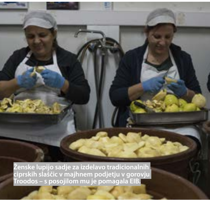
Ženske lupijo sadje za izdelavo tradicionalnih ciprskih slaščic v majhnem podjetju v gorovju Troodos – s posojilom mu je pomagala EIB.

EIB bo še naprej spodbujala naložbe v kmetijstvo in gozdarstvo, ki neposredno prispevajo k blažitvi podnebnih sprememb ali prilagajanju nanje ter krepijo razpoložljivost okoljskih javnih dobrin, kot so krajine, biotska raznovrstnost kmetijskih zemljišč, podnebna stabilnost in večja odpornost na naravne nesreče. V kmetijskih verigah bo EIB še naprej podpirala projekte, ki zagotavljajo učinkovito rabo virov in energije ter prispevajo k proizvodnji bolj zdravih in hranilnih proizvodov, ki imajo tudi manjši okoljski odtis.