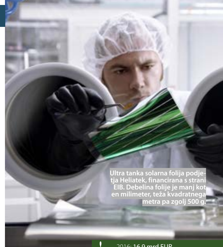
Ultra tanka solarna folija podjetja Heliatek, financirana s strani EIB. Debelina folije je manj kot en milimeter, teža kvadratnega metra pa zgolj 500 g.

Zunaj EU bo EIB še naprej podpirala mikro podjetja ter spodbujala razvoj lokalnega finančnega in zasebnega sektorja s posredovanimi posojili (tudi v lokalnih valutah), vse bolj pa tudi s svetovalnimi storitvami. Skladi, ki pokrivajo potrebe majhnih kmetov, organizacij proizvajalcev ter podeželskih mikro in majhnih podjetij zunaj EU, pogosto rešujejo tudi probleme, kot so migracije ter prilagajanje podnebnim spremembam in njihova blažitev.