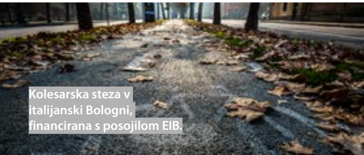
Kolesarska steza v italijanski Bologni, financirana s posojilom EIB.

EIB, vodja divizije za javni sektor in infrastrukturo – Poljska in baltske države