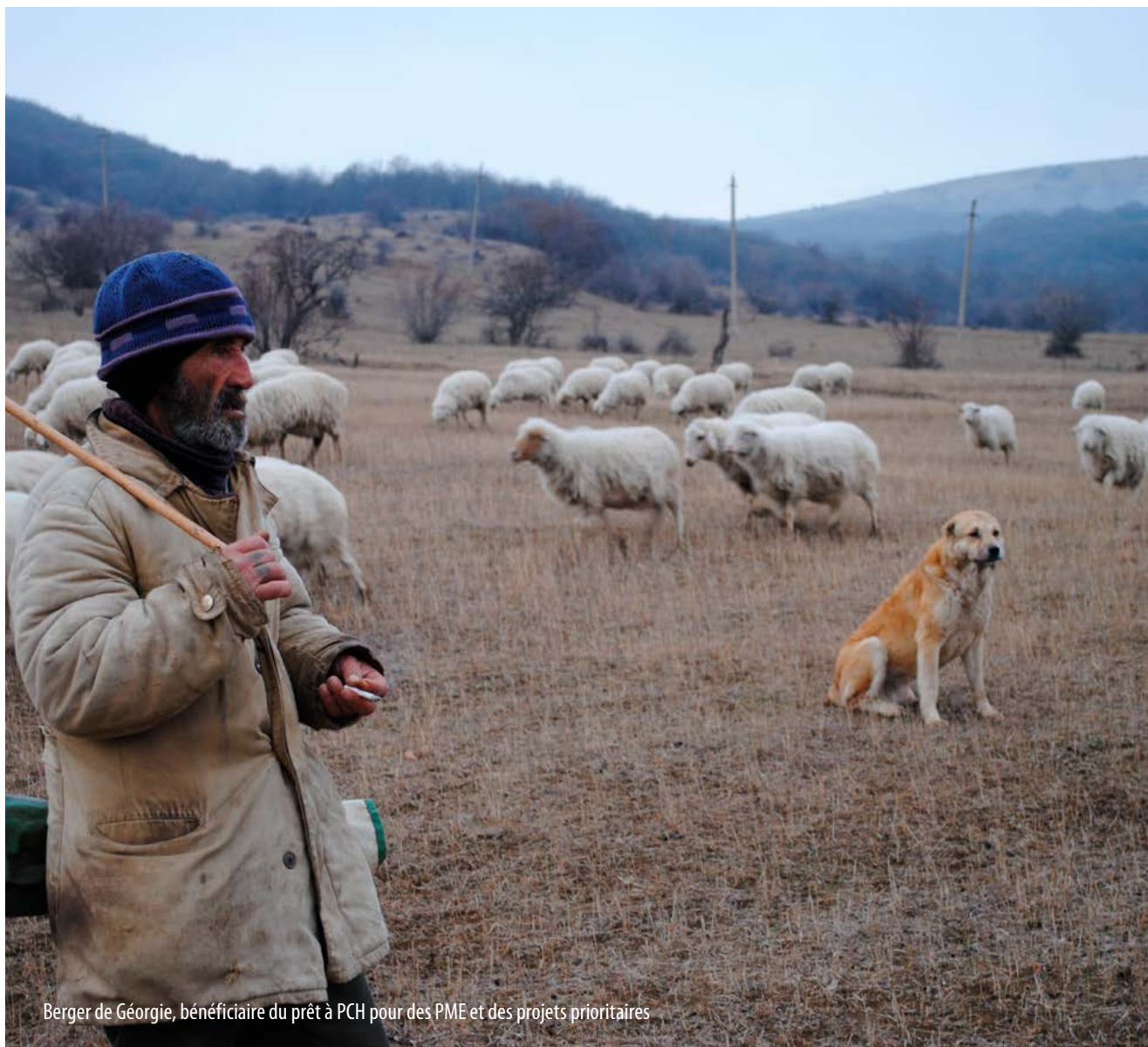
Berger de Géorgie, bénéficiaire du prêt à PCH pour des PME et des projets prioritaires