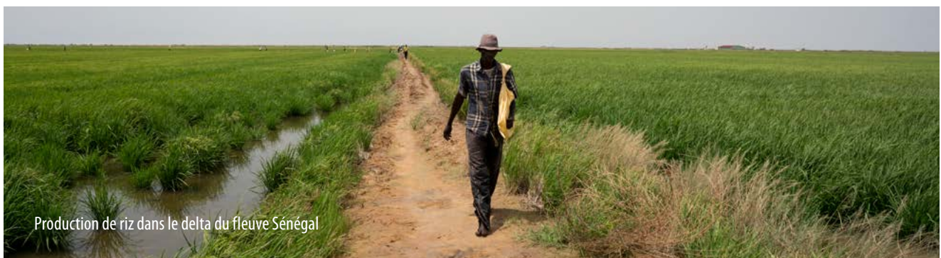
Production de riz dans le delta du fleuve Sénégal