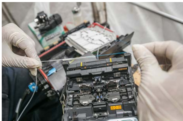
Expansion du réseau d'accès ouvert à fibre optique du promoteur en Irlande