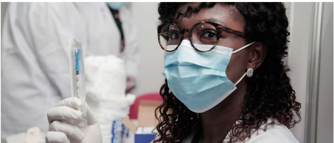
Une infirmière tenant une dose de vaccin contre le COVID-19.

Afin d'accroître l'accès aux vaccins contre le COVID-19 dans les pays à revenu faible ou intermédiaire à l'échelle mondiale, la Banque européenne d'investissement participe à l'initiative COVAX : elle a approuvé un financement de 400 millions d'euros en 2020 et négocie actuellement avec GAVI, l'Alliance du vaccin, une contribution supplémentaire. Grâce à cet engagement, le Groupe BEI contribue à assurer un accès juste et équitable aux vaccins, ainsi qu'aux diagnostics et aux traitements, partout dans le monde.