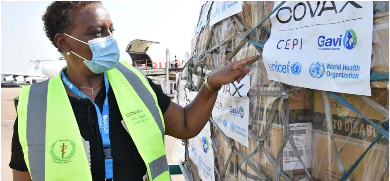
L'opération « COVID-19 Vaccine Volume Allocation » (COVAX).

caces contre ces bactéries tueuses. La BEI a accordé à Scope Fluidics un prêt d'amorçage-investissement de 10 millions d'euros.