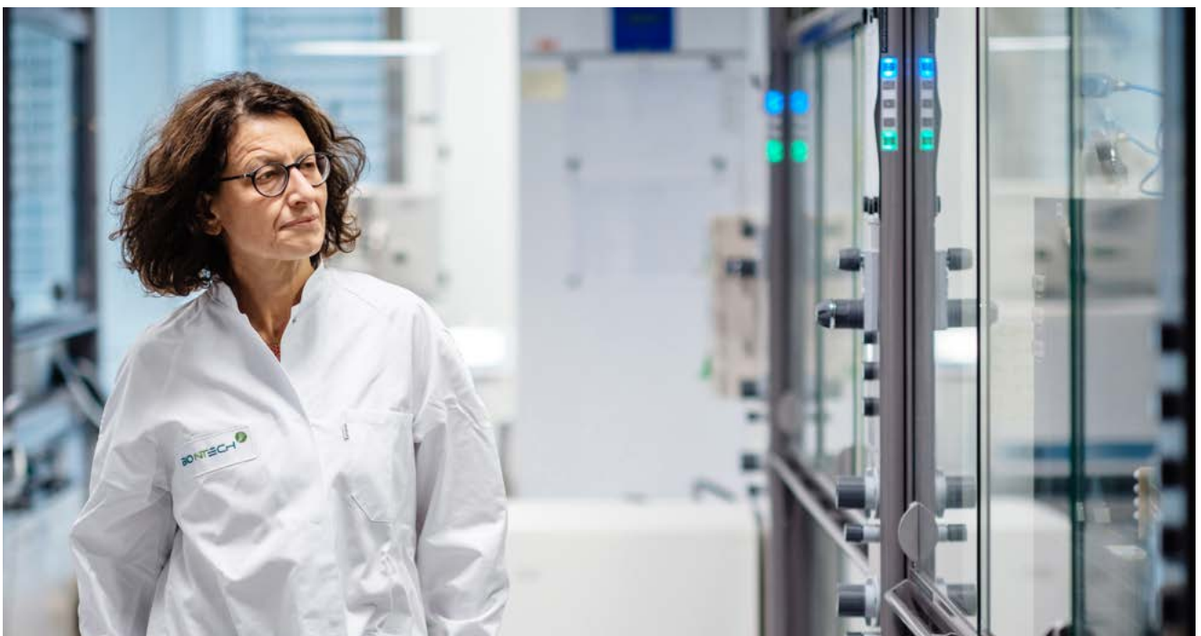
Özlem Türeci et son époux, Uğur Şahin, sont surnommés l'« équipe de rêve », BioNTech ayant rencontré un premier succès avec son vaccin contre le COVID-19.

Le dépistage, le suivi et le traçage sont des étapes cruciales pour empêcher la propagation du virus. L'entreprise polonaise Scope Fluidics a mis au point un système rapide de détection des agents pathogènes viraux et bactériens. Le dispositif entièrement automatisé peut identifier jusqu'à 20 agents pathogènes distincts en 15 minutes. La technologie de Scope Fluidics a une autre application importante au-delà de la pandémie de COVID-19. L'entreprise a créé un système qui aide les médecins à identifier les bactéries résistantes aux médicaments , l'une des plus grandes menaces pour la santé au-delà du COVID-19. Grâce à cette technologie, les médecins pourraient déterminer plus facilement quelles combinaisons d'antibiotiques et d'autres médicaments seraient effi-